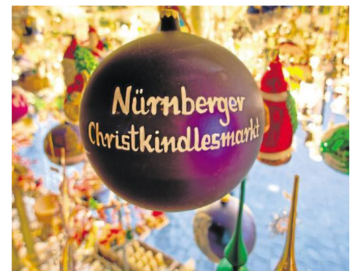
Der Christkindlesmarkt in Nürnberg ist einer von drei Weihnachtsmärkten, die angesteuert werden.